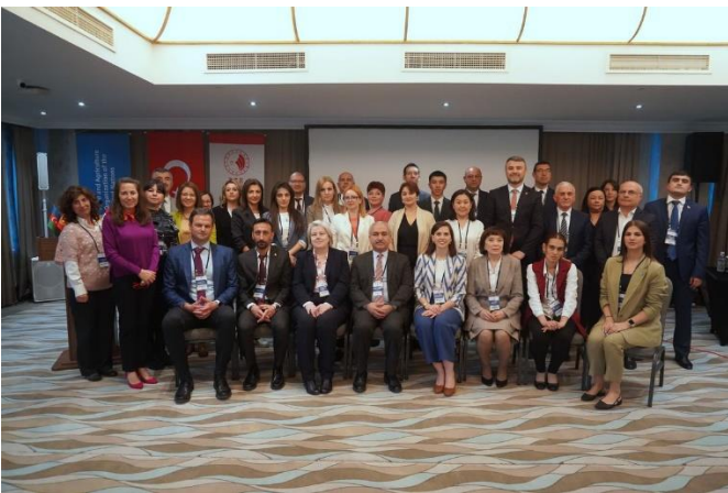
Balıkçılık ve Su Ürünleri Genel Müdürlüğü’nün

Gıda kontrol sistemlerinin etkin çalışması, dijitalleşme ve risk temelli yaklaşımla gıda kontrol prosedürleri ve gıda güvenilirliği risk yönetimi gibi konu başlıklarına sunumlar yapılan çalıştay süresince, uzmanlar arasında tecrübe paylaşımı ve görüş alışverişi gerçekleştirildi.